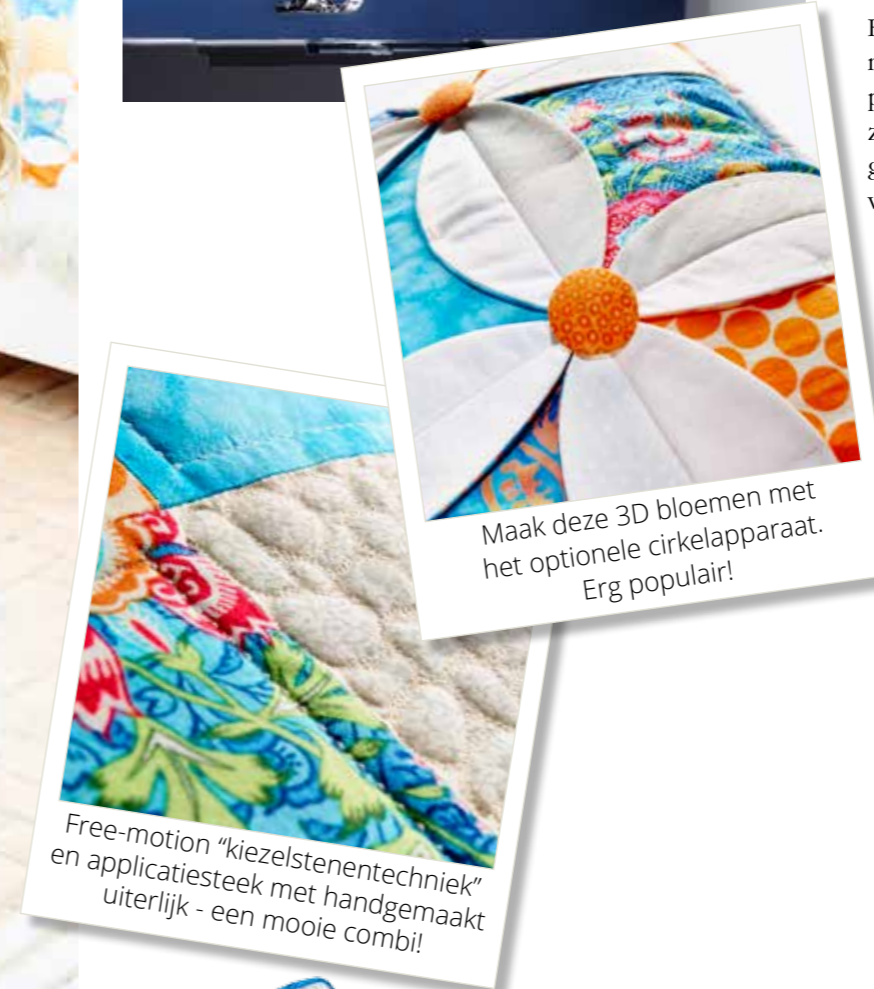
Maak deze 3D bloemen met het optionele cirkelapparaat. Erg populair!

Het kan lastig zijn om een rechte rij knoopsgaten te maken, maar niet met een SAPPHIRE™ naaimachine! Het perfect uitgebalanceerde knoopsgatensysteem naait beide zijden van het knoopsgat in dezelfde richting voor perfect gelijkmatig uitgebalanceerde knoopsgaten. Er zijn zelfs verschillende knoopsgatstijlen waar u uit kunt kiezen.